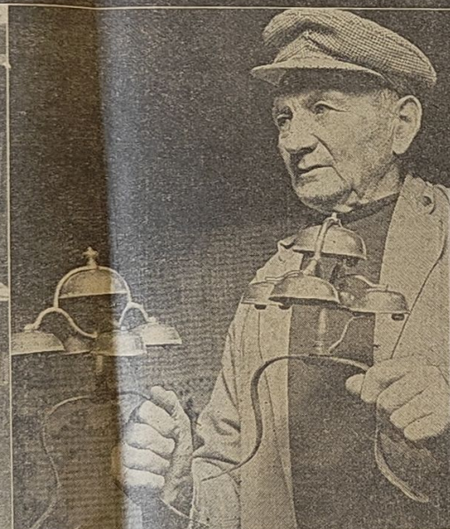
De gamle kanebjælder, fint afstemt, saa de harmonerer er den enlige gardejers yndlinge...