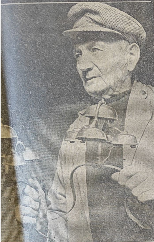
De kanebjælder, fint afstemt, saa de harmonerer er den eneste gaardejers yndlinge...

ed to elektriske varmeovne omkring lænestolen.