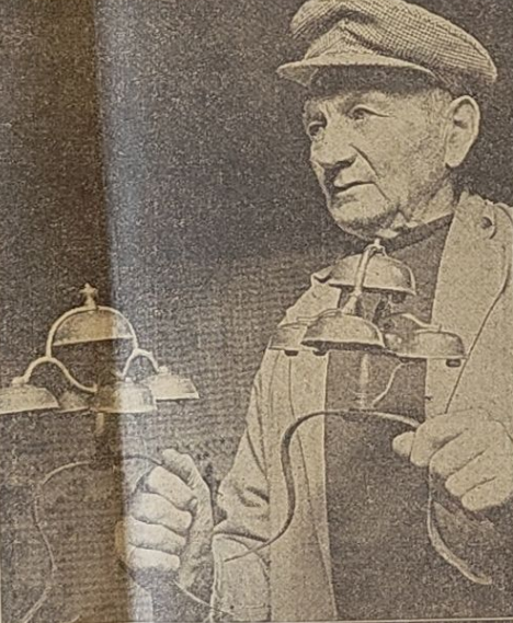
De gamle kasebjælder, fint afstemt, saa de harmonerer ar den enlige gaardejers yndlinge...

Tekst: Hans Erik Boesgaard - Foto: Poul Petersen