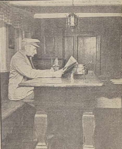
Langbordet i dagligstuen er fra aar 1700, et rent klenodie, siger Nationalmuseet...