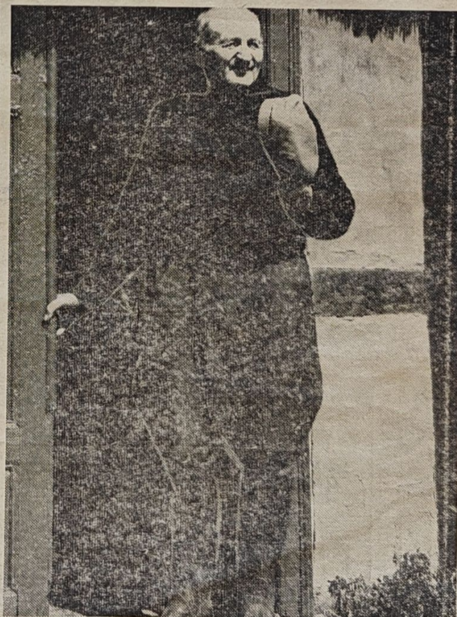
Den gamle gårdmand i haveøren.