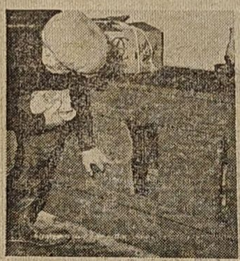
Gåsebænken i køkkenet.