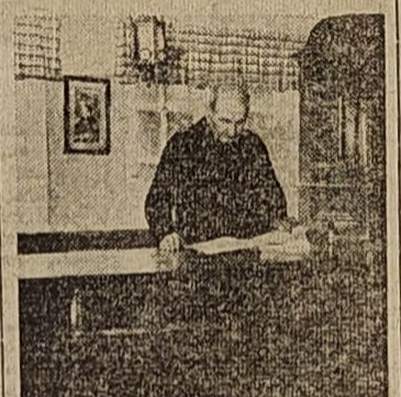
Ved egebordet i stuen.