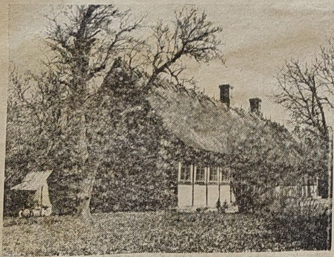
Den lange, smukke stuelænge til gården.